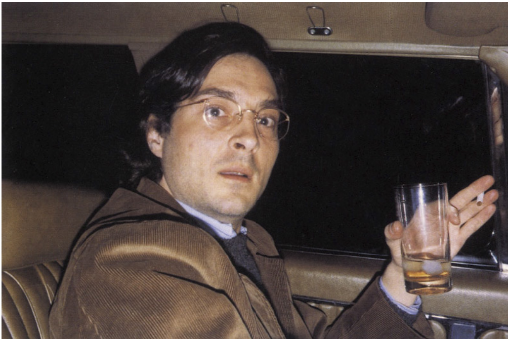
Stephen Shore, Memphis , 1973 (portrait de William Eggleston)

Rédigez une analyse comparée des deux images proposées ci-dessous en vous appuyant notamment sur vos connaissances en histoire de l'art et de la photographie.