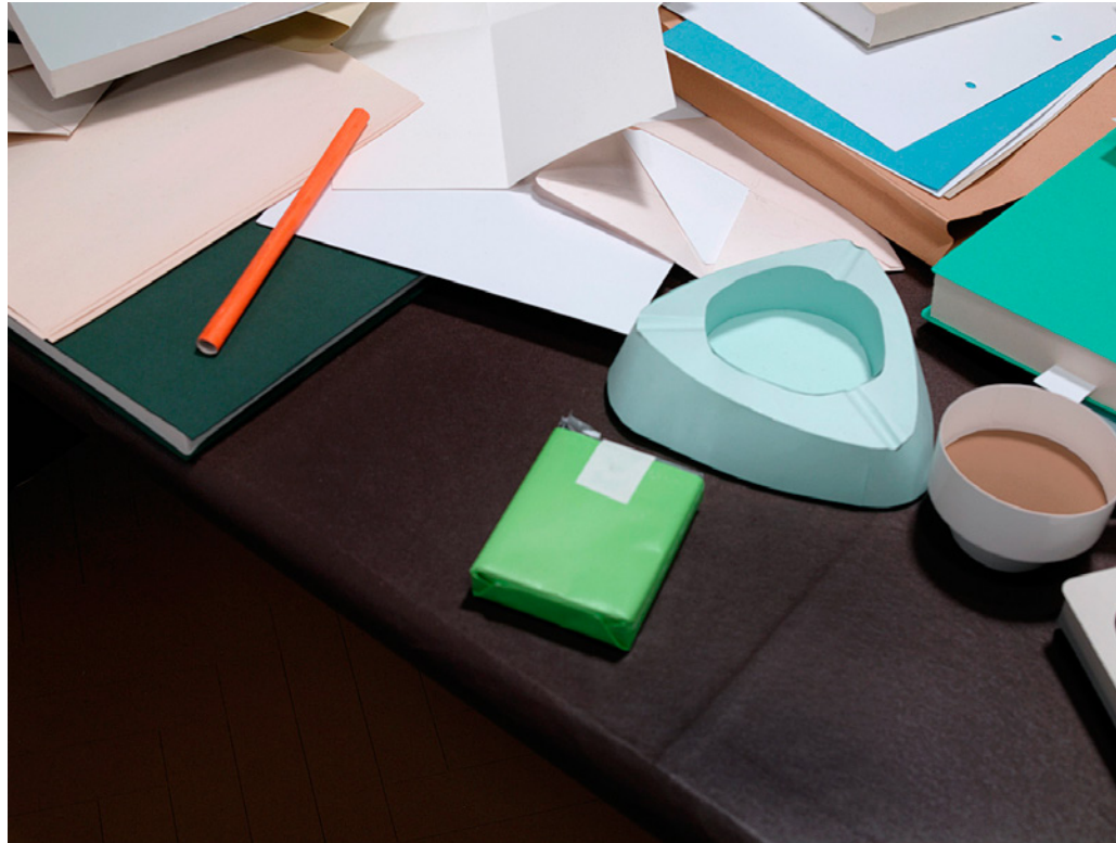
Thomas Demand, Embassy VII.a, 2007. c-print sur Diasec, 52,5x50 cm.